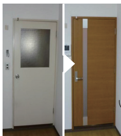
←ドア本体は、 取り替え