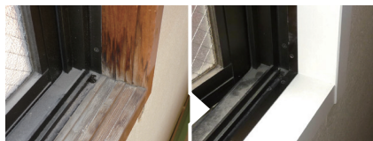
雨水や結露のシミ

掃き出し窓(目安の価格) 幅1,500mm×高さ1,900mm×奥行90mmの場合 通常価格 》》 18,700円(工事費・税込)